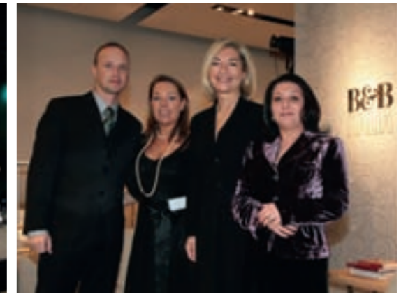
B&B ITALIA TEAM