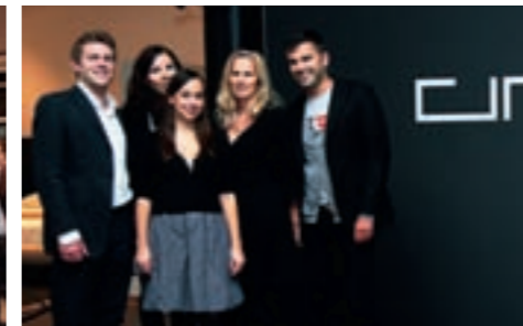
BERNDT & BERNDT TEAM