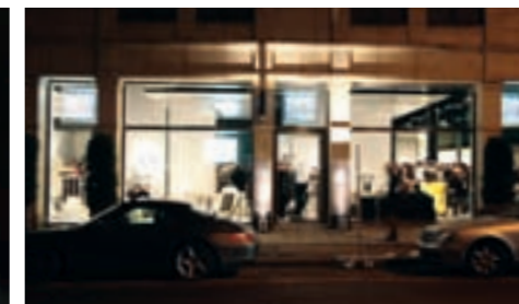
B&B ITALIA STORE AM MAXIMILIANSPLATZ 21