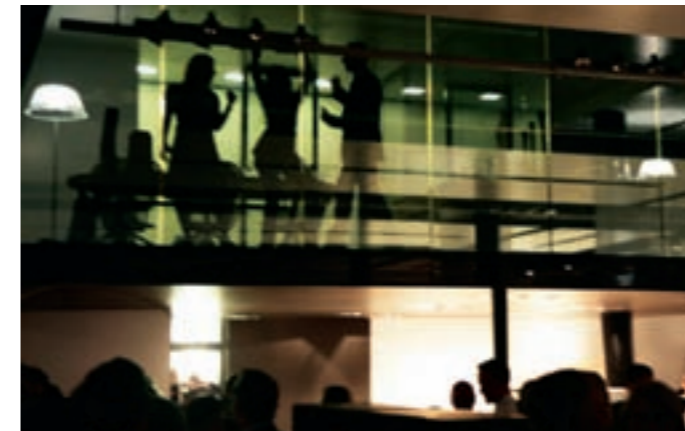
AUSGELASSENE STIMMUNG ZU SPÄTER STUNDE