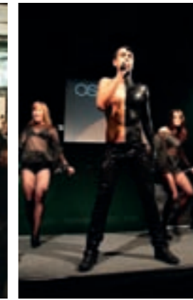
SPECIAL LIVE ACT OSCAR